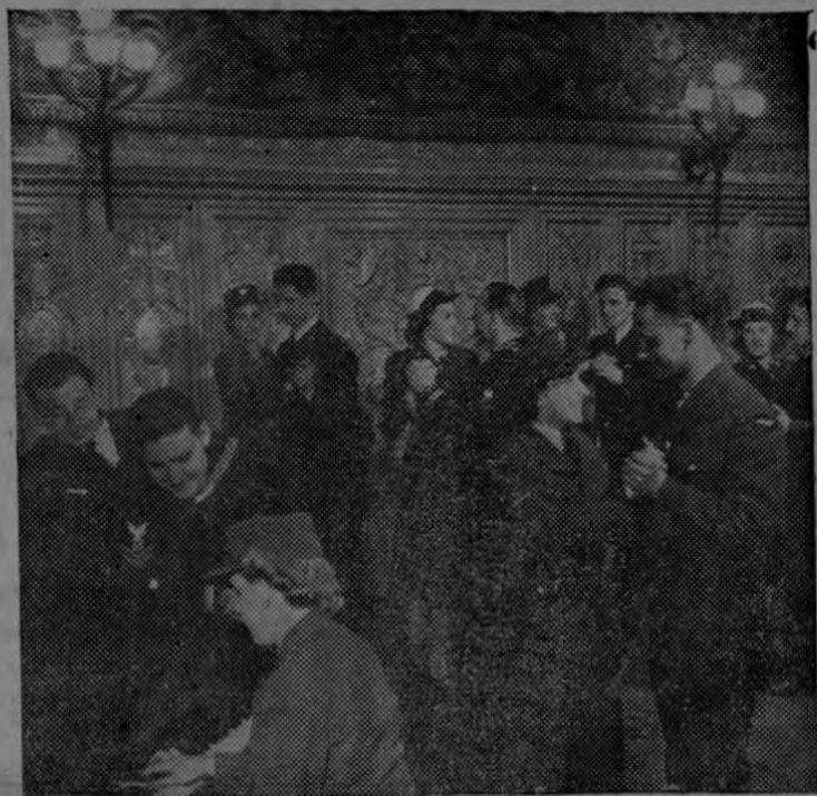
Este dorado salón de baile acoge en su seno a muchachos vestidos en toda clase de uniformes. La joven que aparece en primer término es una canadiense que pertenece a la Fuerza Real Aérea del Canadá.

Si una mujer de fuera hiciera una visita al Centro, se encontraría de improviso con una buena cantidad de muchachas vestidas en uniformes de todas clases, estilos y colores, las cuales estarían gozando de un bien ganado momento de reposo, después de las arduas ocupaciones con las que están contribuyendo a ganar la guerra.