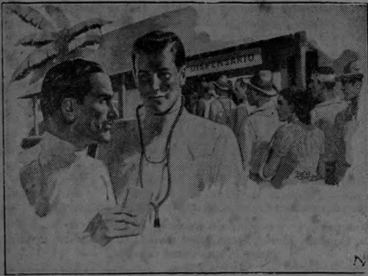
Desde hace cuarenta años viene dirigiéndose hacia el sur, en los barcos de la Gran Flota Blanca, una incesante corriente de médicos, enfermeras, médicas, etc.

NUEVA YORK (Sipa). — Cuando se dió comienzo al desmonte sistemático de tierras selváticas en la América Central y sus contornos para iniciar el cultivo de plátanos—o bananos—en grande escala... cuando se fendieron rieles a través de cálidos y tupidos matorrales... hallábase los hombres que en tales faenas se ocupaban, substraídos del todo del indispensable auxilio médico.